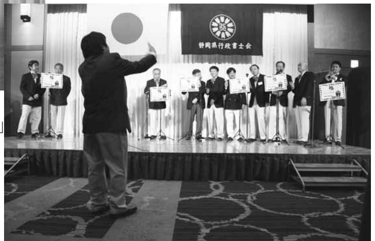
御殿場支部 歌唱「ありがとう行政書士さん」 作詞作曲も会員です