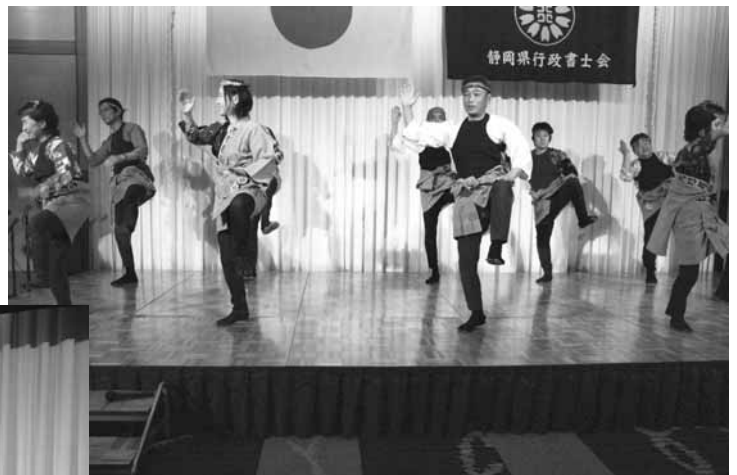
富士宮支部 明るく元気な「宮おどり」