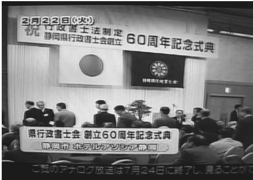
静岡放送TVワイド番組「soleいいね」で紹介されました