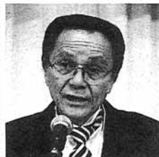
あいさつする堀内会長

士法制定60周年の記念式典を開いた。堀内会長は「行政手続きなどに際して、今後も常に法令を順守し、職業倫理に徹し、日々研さんを重ねて、公正・公平な社会づくりに貢献しよう」と会員に呼び掛けた。 会場となった静岡市葵区のホテルアソシア静岡には、創立当時の会員も含めた約300人が参加。国会議員や県議、関係団体の職員など多くの