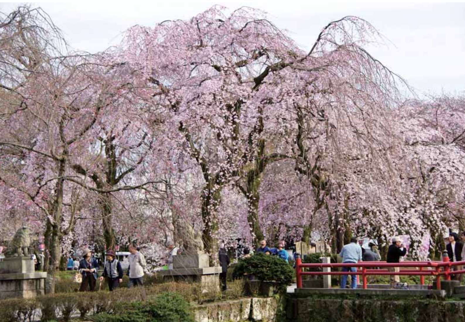
三島大社の満開の桜